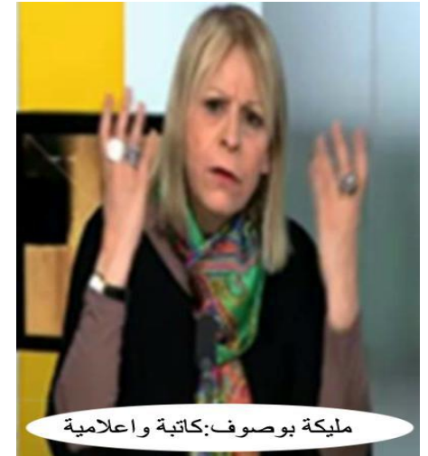
ملكة بوصوف: كاتبة و اعلامية