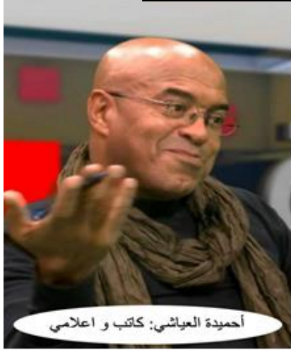
أحمد العياشي: كاتب و إعلامي