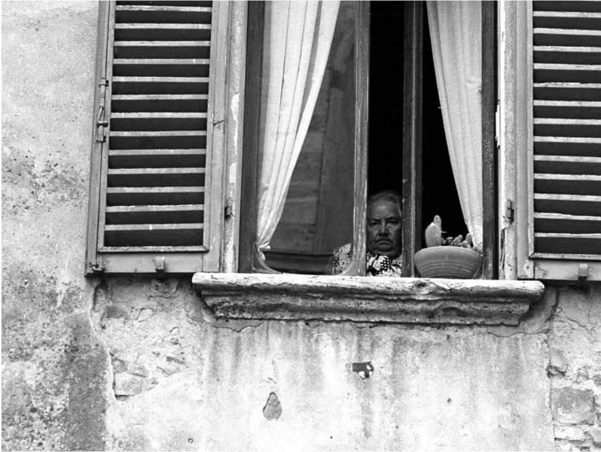
Wanneer een solide sociaal zekerheidsstelsel ontbreekt, is consumptie van het eigen woningvermogen een realistische optie

of door een woning door te geven die al in familiebezit was.