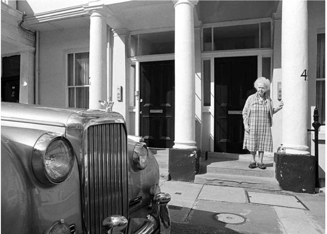
Wie goed boert, heeft het vermogen uit de eigen woning niet nodig om later goed te kunnen leven

dag niet hypotheekvrij te zijn waardoor zij niet in aanmerking komen voor een opeethypotheek. Interessant is dat de enkele jongeren die verwachten zelf pensioenvermogen op te moeten bouwen, ook zeggen te hebben gekocht als investering voor later. Soms wordt dit aangemoedigd door de ouders van geïnterviewden die spijt hebben dat ze nooit hebben gekocht en hun leeftijdsgenoten rijk hebben zien worden door de stijgende huizenprijzen. Tenslotte blijkt voor zelfstandigen het woningvermogen belangrijk: men zou goedkoper gaan wonen om vermogen te kunnen consumeren.